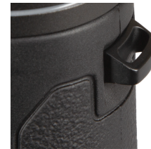
Fig. 5 Lengüeta de correa

Para poner la correa del cuello, pase los extremos de la correa por el asa de la correa ( Fig. 5 ) a cada lado de los prismáticos, luego retroceda a través de la hebilla de plástico que hay en la correa ( Fig. 6 ). Ajuste la posición de los prismáticos en su pecho mientras cuelgan de su cuello como prefiera, cambiando la longitud de la sección de correa que atraviesa el canal y la hebilla de la correa la misma cantidad en cada lado. Si prefiere usar una correa de posventa con anillos metálicos, engánchelos en una cremallera de plástico que hay en las lengüetas en vez de instalarlas directamente en ella, para evitar dañar el acabado de los prismáticos por contacto con los anillos.