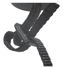
Fig. 6 Attache et boucle