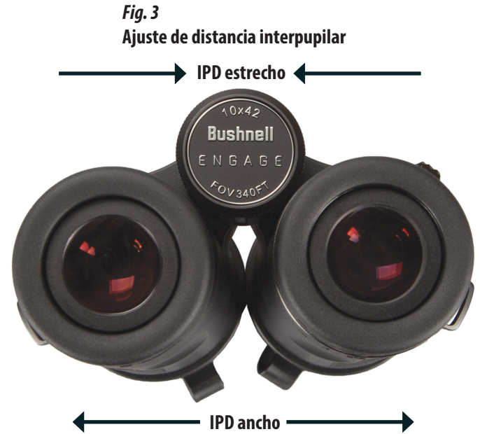
Fig. 3 Ajuste de distancia interpupilar