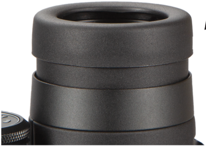
Fig. 2 Eyecup in “Up” Position (for use without eyeglasses)