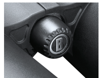
Abb. 7 Kappe der Stativfassung

Um das Fernglas auf einem Drei- oder Einbeinstativ zu befestigen, schrauben oder ziehen Sie die Kappe ab, die die Gewindemuffe auf der hinteren Seite des mittleren Scharniers abdeckt, (Abb. 7), und legen Sie sie an einem sicheren Platz ab. Verwenden Sie einen kompatiblen Fernglas-Stativ-Adapter (90° Befestigungswinkel), wie etwa das Bushnell-Modell 161002CM, um Engage-Fernglas auf einem beliebigen Standardstativ in einer horizontalen Position zu befestigen, um bei längerer Betrachtung für ein stabiles Bild zu sorgen.