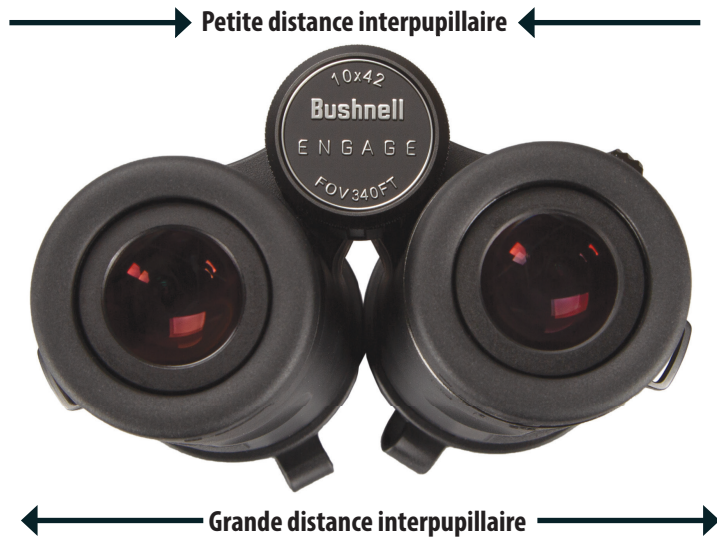
Fig. 3 Inter-pupillaire Ajustement de la distance

pas à régler la bague de dioptrie afin de mettre l'objet au point pour votre œil droit, assurez-vous que le côté gauche est toujours mis au point (recommencez les étapes 2 à 4 si nécessaire). Le réglage de la dioptrie offre essentiellement une « mise au point précise » d'un côté des jumelles (droit uniquement) pour permettre de légères différences de vision entre votre œil droit et votre œil gauche.