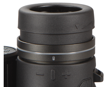
Fig. 4 Bague de réglage de la dioptrie (modèle BEN1042, déverrouillé)