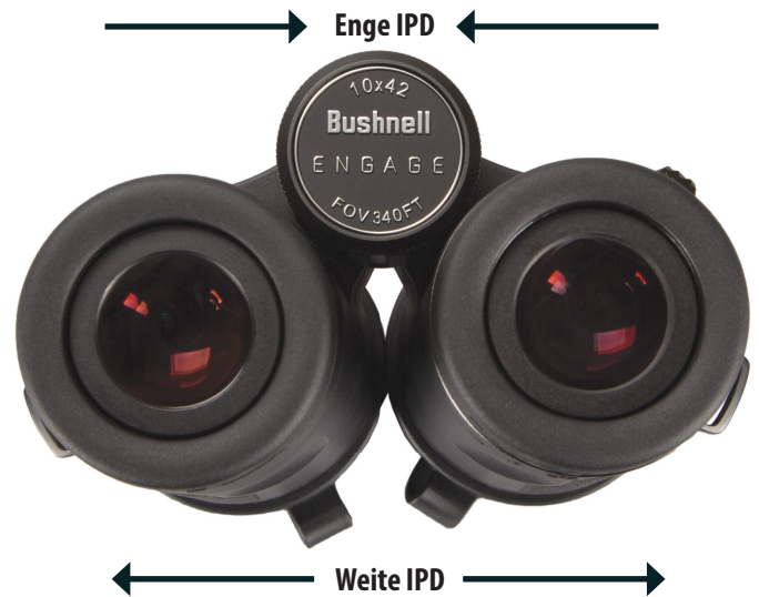
Abb. 3 Augenabstand (IPD – Interpupillary Distance) Abstandanpassung

ihn öffnen (siehe Abb. 4). Vermeiden Sie ein Überdrehen oder Forcieren des Dioptrienmechanismus. Falls es Ihnen nicht gelingt, das Objekt durch Anpassung des Dioptrienrings für Ihr rechtes Auge scharf zu stellen, überprüfen Sie, ob die linke Seite immer noch scharf ist (wiederholen Sie gegebenenfalls Schritte 2 - 4). Die Dioptrienanpassung sorgt im Grunde für den „Feinfokus“ auf einer Seite des Fernglases (nur rechts), um leichte Unterschiede in der Sehkraft Ihres linken und rechten Auges zu berücksichtigen.