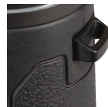
Fig. 5 Attache de bandoulière

Pour fixer les jumelles sur un trépied ou monopode, dévissez ou retirez le capuchon qui couvre le manchon à vis à l'extrémité de la charnière centrale ( Fig. 7 ) et déposez-le en lieu sûr. Utilisez un adaptateur de trépied pour jumelles compatible (support à angle de 90°) tel que le modèle Bushnell n° 161002CM, pour fixer vos jumelles Engage sur un trépied standard en position horizontale afin d'obtenir une image stable lors de l'observation prolongée.