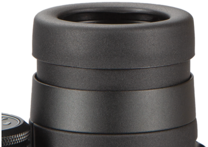
Abb. 2 Augenmuschel in der "oben"-Position (für die Verwendung ohne Brille)