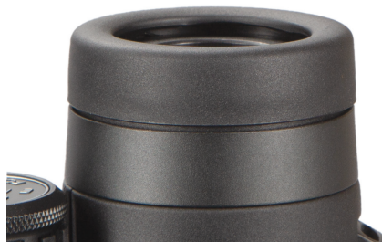
Fig. 1 Conchiglia oculare in posizione "abbassata" (per l'uso con occhiali)