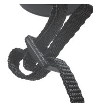
Fig. 6 Cinghia e fibbia