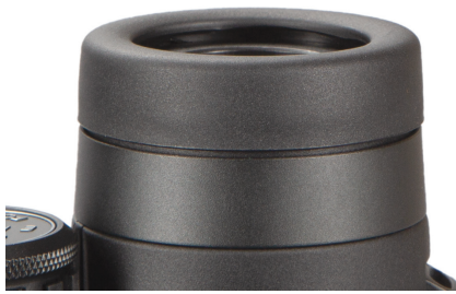
Abb. 1 Augenmuschel in der "unten"-Position (für die Verwendung mit Brille)