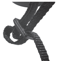
Abb. 6 Riemen & Schnalle