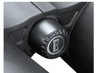
Fig. 7 Manchon de fixation du trépied avec capuchon

Toutes les surfaces extérieures des lentilles comportent notre nouveau revêtement EXO Barrier™ (outre un multi-revêtement intégral). EXO Barrier, est tout simplement la meilleure technologie de revêtement de protection des lentilles jamais développée par Bushnell. Ajouté à la fin du processus de protection, EXO Barrier se lie moléculairement à la lentille et remplit les pores microscopiques dans le verre. Il en résulte une protection ultra-fine qui repousse l'eau, l'huile, le brouillard, la poussière et les débris - la pluie, la neige, les traces de doigts et la saleté n'adhèrent pas. EXO Barrier est fabriqué pour durer : la protection collée ne s'atténue pas avec le passage de temps ou en raison de l'usure normale.